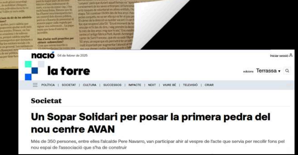
La Cecot, CercleMón i la Fundació AVAN recapten 20.263 euros per ajudar a l'atenció de persones amb malalties neurològiques a Terrassa