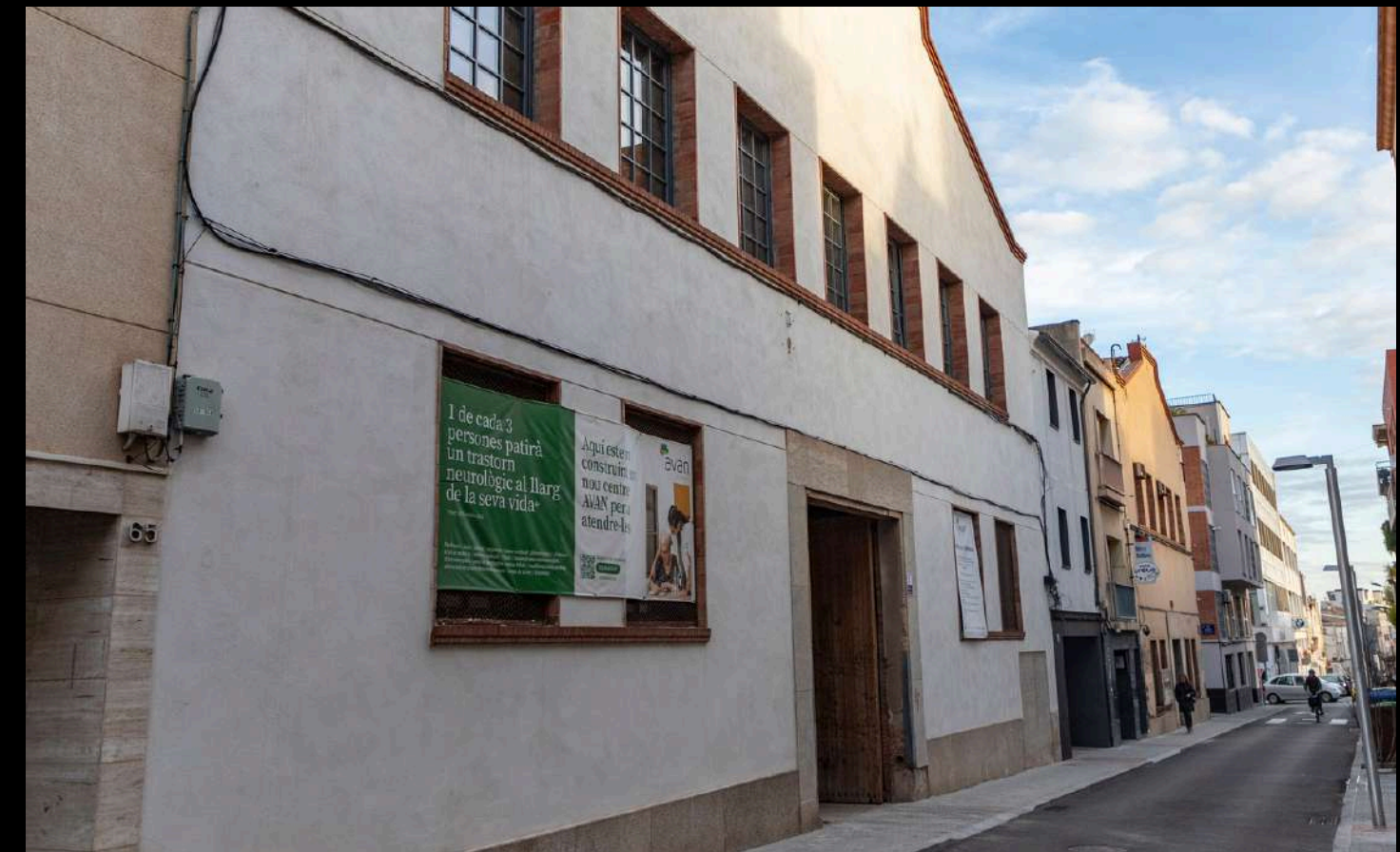
Fachada del nuevo centro AVAN en Terrassa ( C/St. Francesc, 71)