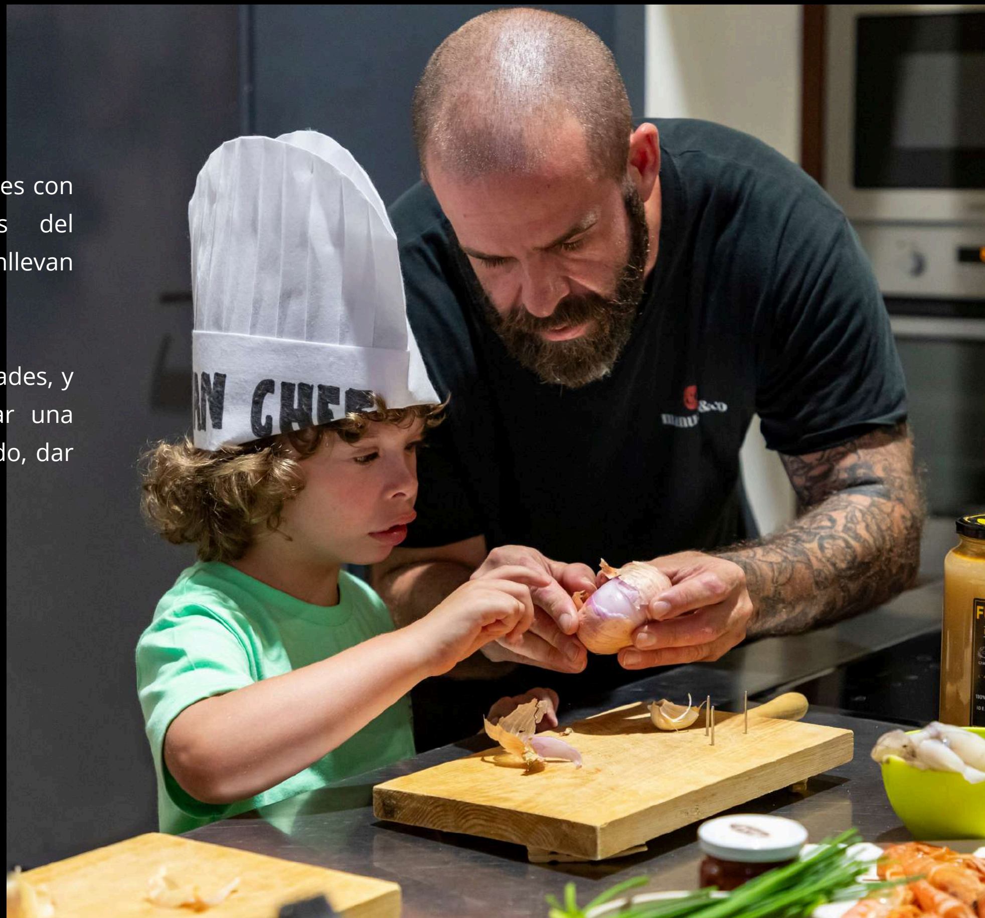
Las instalaciones del Petit AVAN en Sabadell y Sergio, usuario del Petit AVAN, y su padre, en una actividad familiar para el Calendari Solidari AVAN 2025